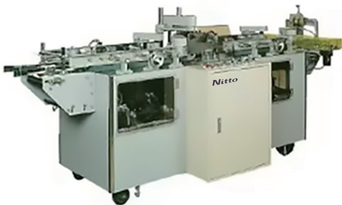
受注生産機の対応のため、写真と異なる場合があります。 標準塗装色：ニトマチックホワイト(マンセル近似色 2.5Y8.5/1)